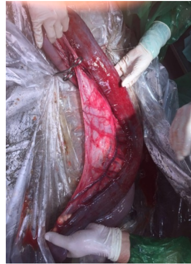
Kolik am Dünndarm