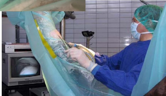
Chip-OP am Knie