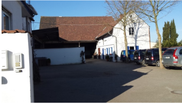
Blick durch das Tor