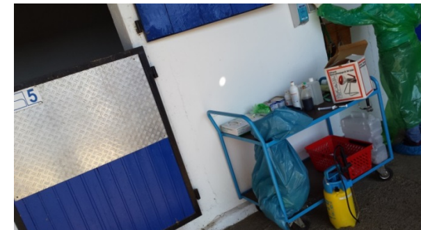
Vor der Isolationsbox